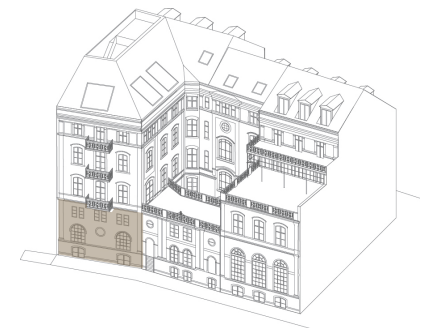
Ansicht von Nordwesten - Spreeseite